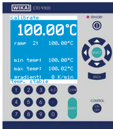
Menu pomiarów i kalibracji

Możliwe jest kalibrowanie automatyczne z użyciem komputera PC/laptopa oraz oprogramowania kalibracyjnego.