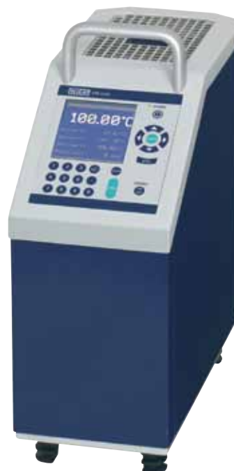
Kalibratory temperatury z suchym otworem pomiarowym model CTD9300