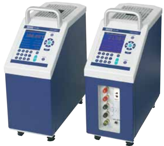
Kalibratory temperatury z suchym otworem pomiarowym model CTD9300